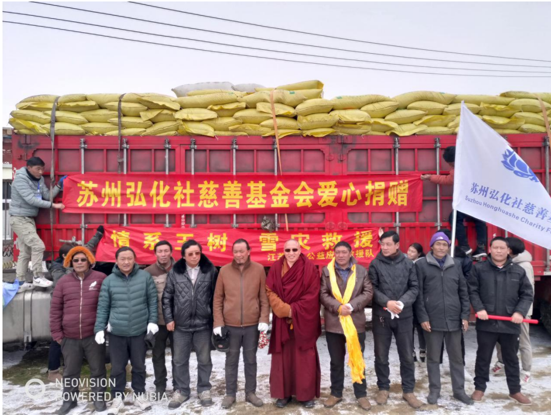
五个村的牧民都到了现场帮忙卸车，然后由村长分发给牧民。