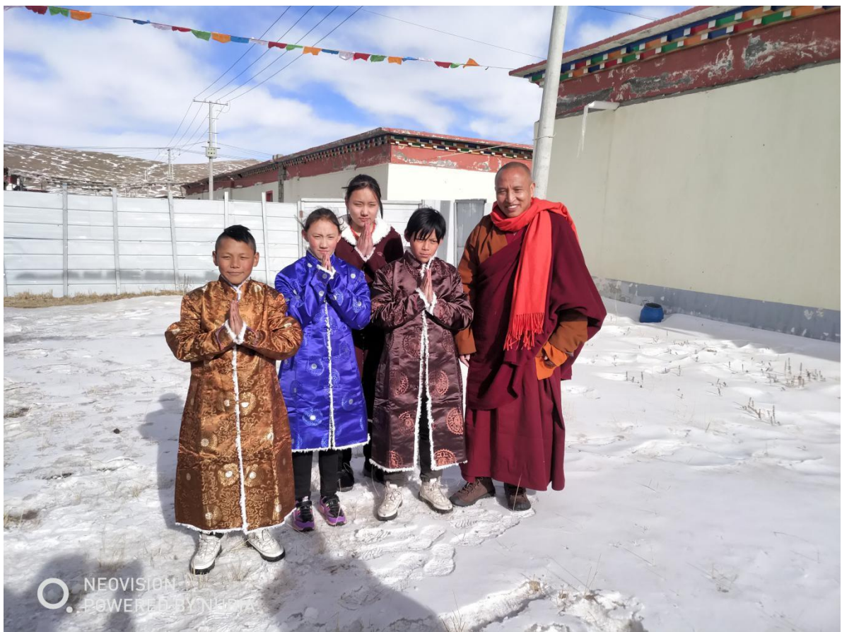
饲料藏袍都做了相关的签收工作