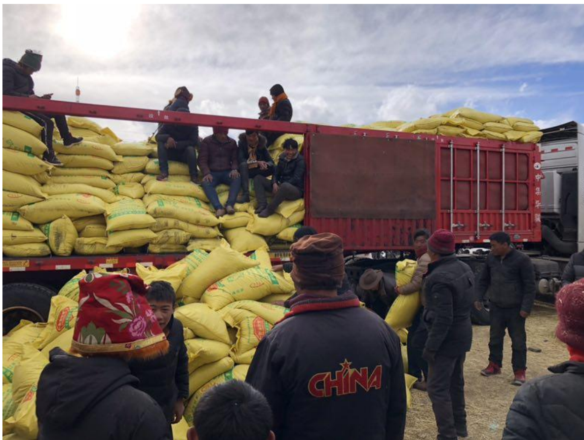
上师在给灾区小朋友发放藏袍，穿上新的藏袍瞬间不怎么冷了。内心暖暖的！