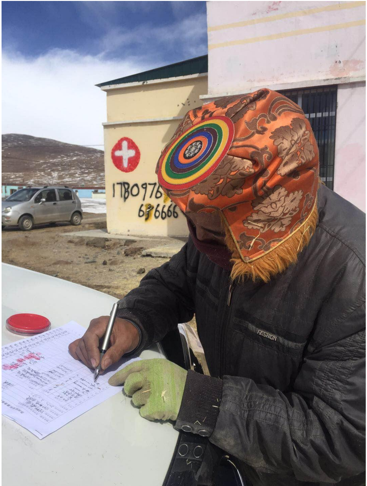
此次玉树称多县灾区饲料 232900 包含运费