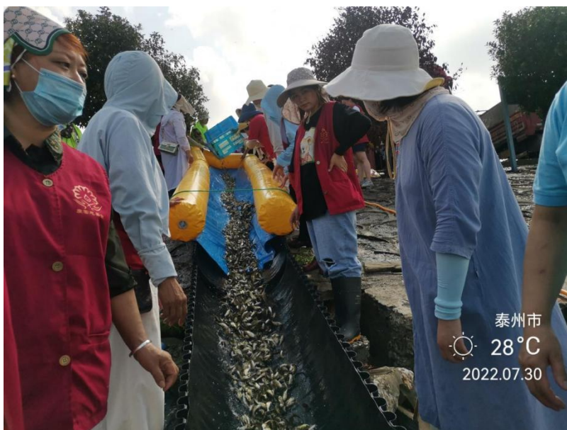
2022 年 7 月 30 日苏州弘化社慈善基金会护生项目组，联合扬州文峰慈善基金会，泰兴庆云慈善会花费 104976 元，用于长江泰州段“保护长江”生态放流活动。