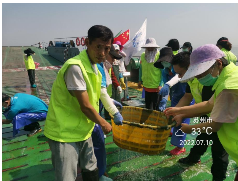
2022年7月10日苏州弘化社慈善基金会护生项目组，联合苏州市兴福公益基金会花费97002元，用于长江常熟段“保护长江”生态放流活动。