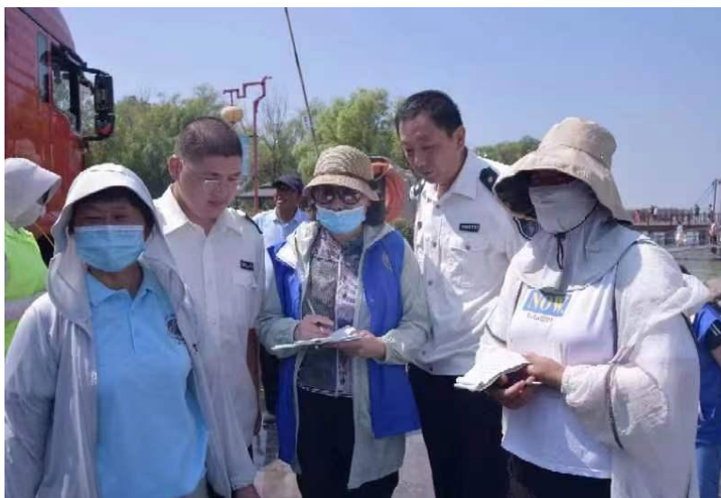
2022 年 7 月 24 日苏州弘化社慈善基金会护生项目组，联合扬州文峰慈善基金会花费 101640 元，用于洪泽湖“保护洪泽湖”生态放流活动。